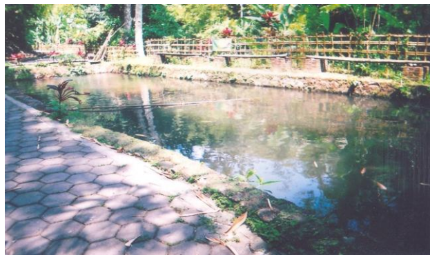
Gambar 5. Pemancingan Desa Wisata Kembang Arum