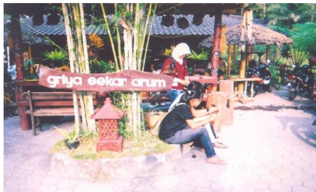
Gambar 1. Gerbang Desa Wisata Kembang Arum

sangat digemari wisatawan dari tingkat TK, SD, SMP, SLTA, Perguruan Tinggi, dan instansi. Selain mengandung aspek rekreasi, kegiatan out bond juga mengandung aspek pendidikan dan aspek challenge . Dengan demikian nilai-nilai yang terkandung diantaranya adalah nilai kreativitas, humanitas, komunikasi, kepribadian, kepemimpinan, solidaritas, survival , obyektivitas, dan pengambilan keputusan. Adapun kondisi, situasi, dan potensi Desa Wisata Kembang Arum dapat dilihat pada gambar di bawah ini: