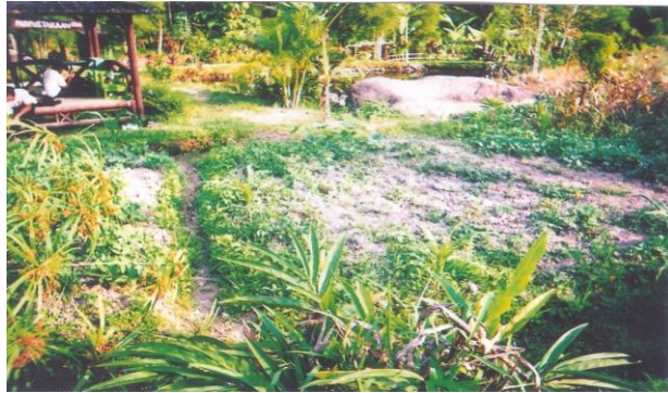
Gambar 4. Perkebunan Desa Wisata Kembang Arum