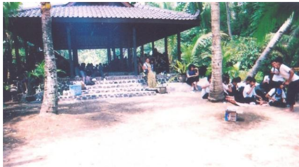
Gambar 2. Pendopo Desa Wisata Kembang Arum