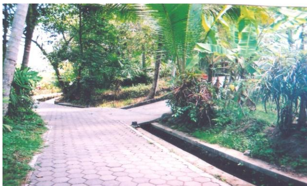
Gambar 3. Taman Desa Wisata Kembang Arum