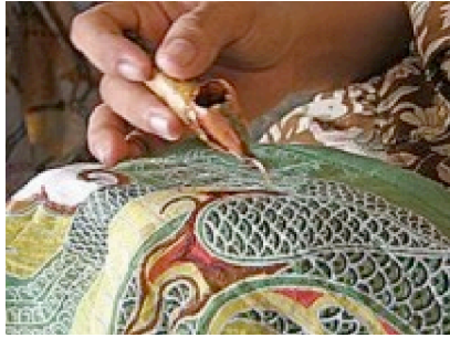
Ilustrasi membatik dengan canting/ batik tulis

Motif Batik secara garis besar terdapat dua golongan motif batik, yaitu motif geometris dan non geometris, Sewan Susanto (1980: 212) mengadakan pembagian motif menjadi dua bagian utama yaitu (1) ornamen motif batik yang dibedakan menjadi ornamen utama dan ornament tambahan, (2) isen motif batik berupa titik-titik, garis-garis dan gabungan titik dan garis, yang berfungsi untuk mengisi ornamen-ornamen dari motif utama atau bidang diantara ornamen-ornamen tersebut. Isen ini diberi nama cecek , cecek pitu , cecek sawut , cacah gori , dan lain sebagainya.