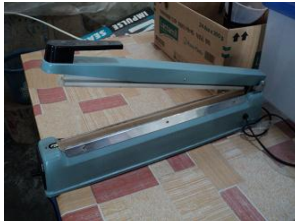
Gambar 4. Mesin sealer

Tahapan pengemasan yang dilakukan dapat dijelaskan sebagai berikut: