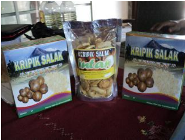
Gambar 3. Kemasan keripik salak

Industri keripik salak menerapkan kemasan pada produk keripik salak agar memenuhi tujuan seperti yang telah diuraikan di atas. Kemasan yang digunakan terdiri dari plastik alumunium foil pada bagian dalam dan dimasukkan ke dalam pembungkus karton. Alat untuk merapatkan pembungkus plastik dengan menggunakan peralatan sealer yang cukup sederhana dan murah. Pengemas dan alat yang digunakan dapat dilihat pada gambar 4 berikut.