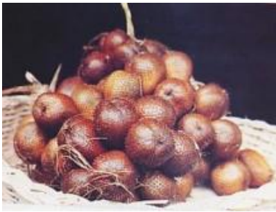
Gambar 1. Contoh Produk Salak dari Kecamatan Turi

Untuk mengatasi masalah tersebut, pada saat ini para petani di daerah Kecamatan Turi telah mengembangkan peluang usaha baru dengan menggunakan bahan baku salak. Hasil panen salak yang melimpah, diolah menjadi berbagai macam produk makanan maupun kerajinan tangan. Produk makanan yang dihasilkan antara lain berupa: kripik salak, dodol salak, gethuk salak, selai salak, dan sirup salak. Selain itu biji salak dan kulit salak juga dapat dijadikan sebagai bahan baku pembuatan kerajinan tangan, biji salak dapat disulap menjadi bantalan jok kursi mobil yang cantik setelah dirajut sedangkan kulit salak dapat dijadikan gantungan kunci yang unik dan lucu.