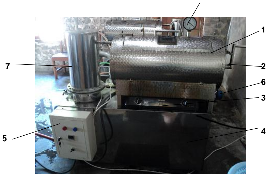
Gambar 2. Mesin Penggoreng Vakum Kapasitas 5 Kg

pengemasan. Kegiatan ini diikuti semua anggota UKM. Semua anggota terlibat dari awal hingga akhir. Mesin penggoreng vacuum yang digunakan seperti terlihat pada gambar berikut.