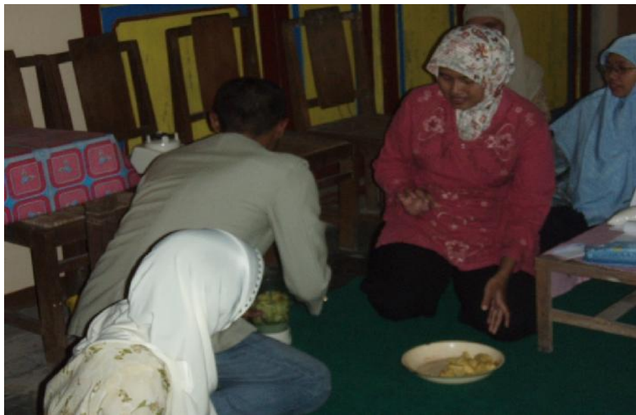
Praktek Pembuatan Bioekstrak