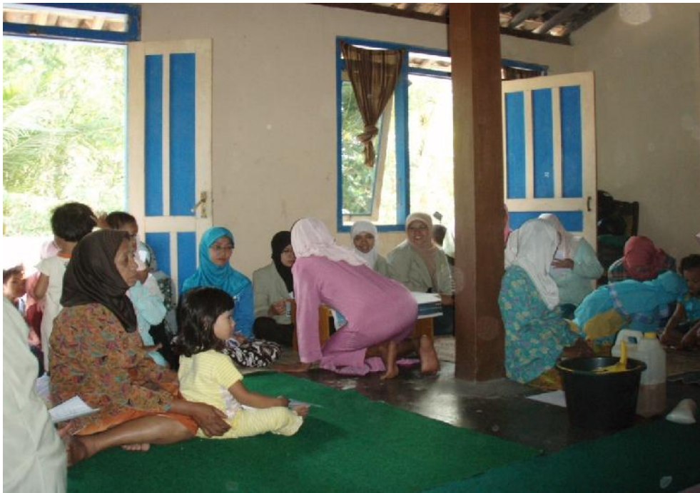
Evaluasi Keberlanjutan Program