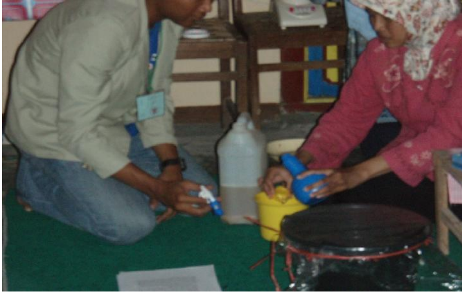
Pengaturan Dosis Penggunaan Bioekstrak