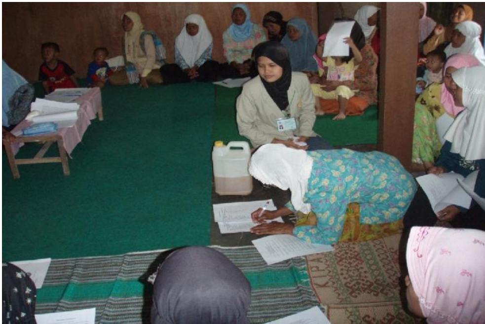
Evaluasi Pelaksanaan Kegiatan