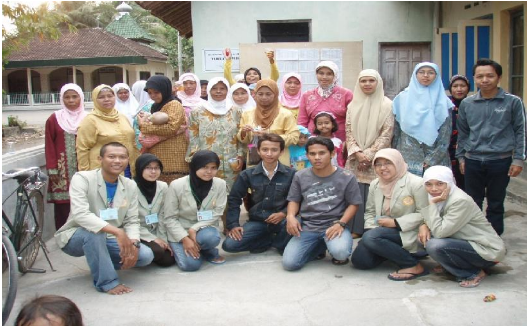
Penutupan Kegiatan Pelatihan bersama Mahasiswa dan KKN UGM 2009