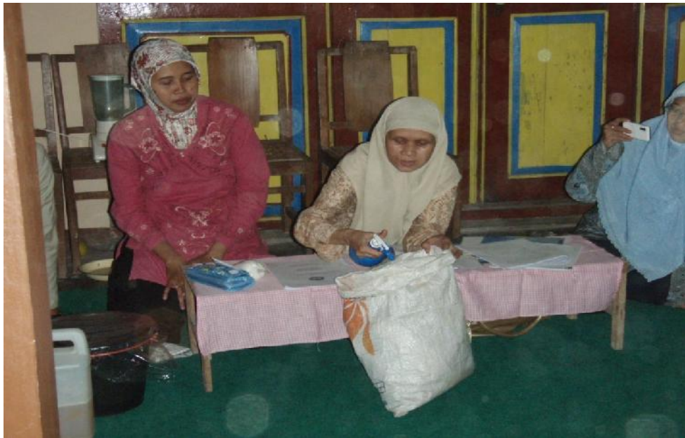
Praktek Penggunaan Bioekstrak Untuk Mempercepat Penghancuran Sampah Daun