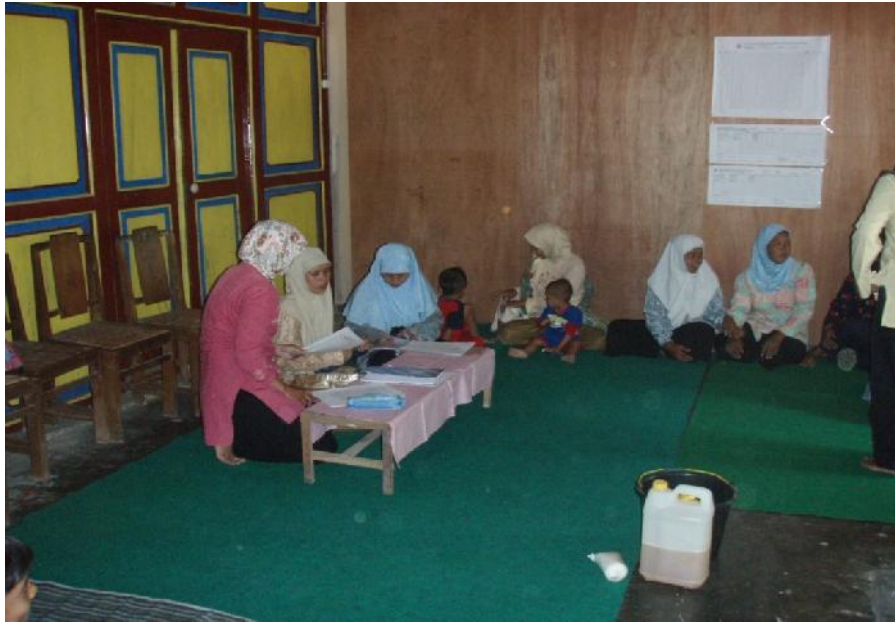
Persiapan Pelatihan Pembuatan Bioekstrak