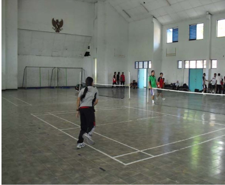
Gambar 4. Praktek Teknik Servis