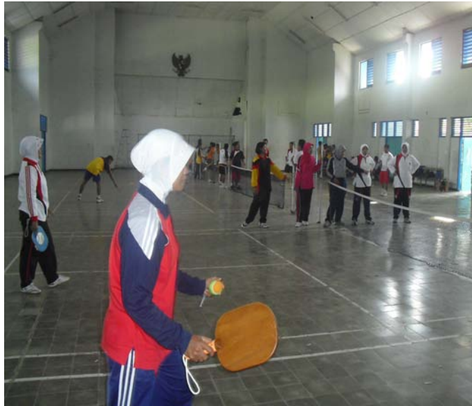
Gambar 5. Praktek Bermain