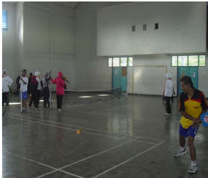
Gambar 3. Praktek Teknik Backhand Grounstrokes