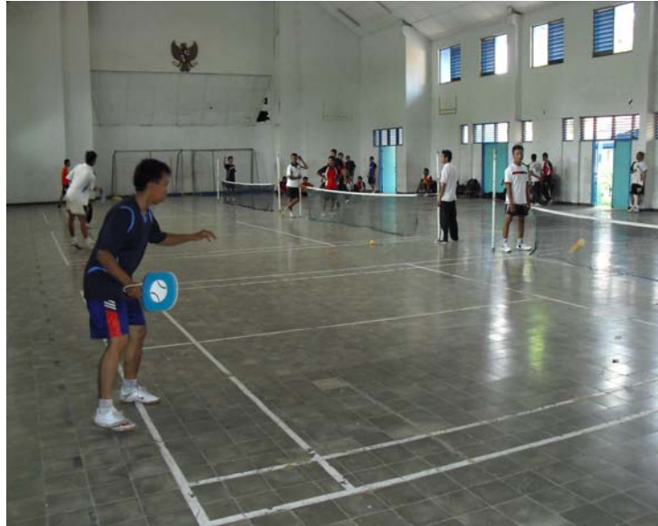
Gambar 2. Praktek Tektik Forehand Groundstrokes