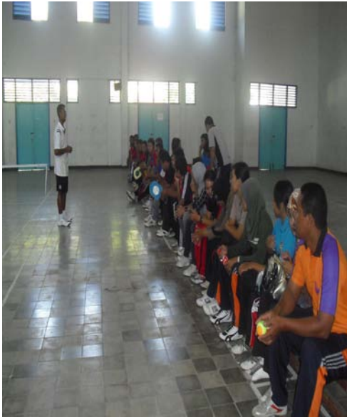
Pemateri Memberi materi Teori