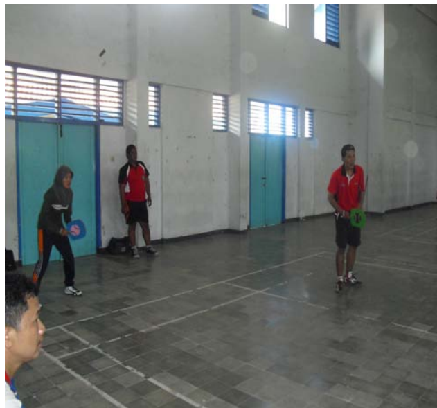
Gambar 1. Pemberian Materi