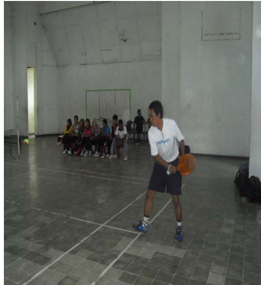
Pemateri Memberi Contoh