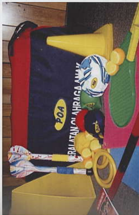
Gambar 2. Seperangkat Peralatan Olahraga Anak (POA).