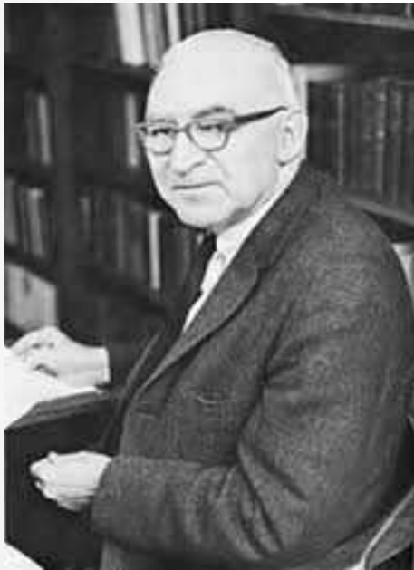
Harold Lasswell (1960)