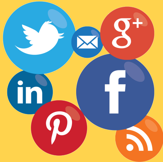
Efisiensi Pasar Secara Informasi