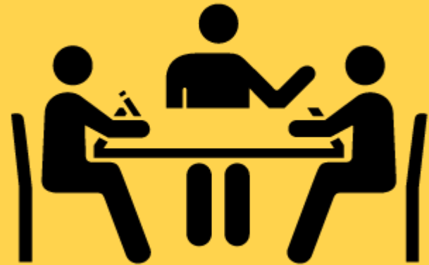
Efisiensi Pasar Secara Keputusan