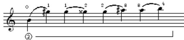
Gambar 2. Slur Naik

Cara memainkan slur turun pada gambar 1 yaitu dengan menarik jari 4 pada nada b^2 menuju nada ais^2 yang ditekan dengan jari 3, namun kedua jari tersebut sudah siap terlebih dahulu dalam keadaan menekan senar ② di posisi IX (jari 4 pada fret 12, dan jari 3 pada fret 11), sehingga saat jari 4 menarik nada b^2 , maka langsung menuju nada ais^2 . Dua buah nada yang berbeda dimainkan dengan teknik slur jika ditandai dengan adanya garis lengkung ( \frown ) di atas atau di bawah nada-nada tersebut.