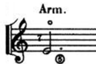
Gambar 2. Contoh nada yang dimainkan dengan teknik natural harmonic

Dengan melihat gambar cara memainkan teknik artificial harmonic pada gambar 1, maka diharapkan mahasiswa dapat mencoba memainkan teknik tersebut secara mandiri. Selanjutnya dapat menerapkannya ketika memainkan lagu-lagu yang di dalamnya terdapat teknik artificial harmonic (harmonic buatan). Berikut disajikan pula contoh nada yang dimainkan dengan teknik harmonic serta gambar lain tentang posisi tangan kanan saat memainkan teknik artificial harmonic dilihat dari sudut yang berbeda, tepatnya posisi jari telunjuk (jari i ) tangan kanan ketika menyentuh senar di fret 13.