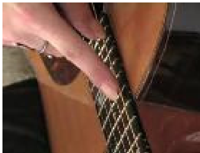
Gambar 3. posisi jari telunjuk (jari i ) tangan kanan ketika menyentuh senar di fret 13, dilihat dari samping