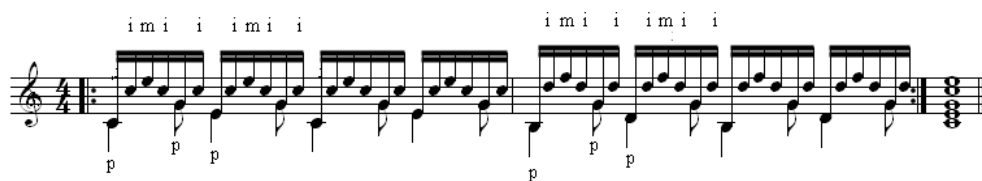
Gambar 5. Contoh akor dimainkan arpeggio

Arpeggio , juga ditandai dengan sebuah garis vertikal yang berlekuk-lekuk. Nada-nada dalam sebuah akor yang dimainkan secara arpeggio , umumnya dimainkan dari pitch yang paling rendah ke pitch yang paling tinggi, kecuali pada akor yang akan dimainkan ditandai dengan panah ke bawah (seperti terlihat pada gambar 6). Selanjutnya gambar 5 dan 6 merupakan contoh arpeggio yang dapat dimainkan pada gitar.