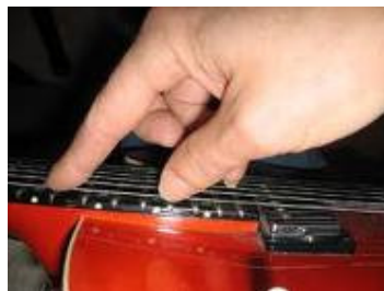
Gambar 4. posisi jari telunjuk (jari i) tangan kanan ketika menyentuh senar di fret 13, dilihat dari atas