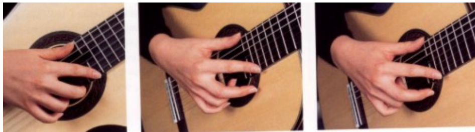
Gambar 1. Posisi tangan kanan untuk memainkan teknik artificial harmonic

Selanjutnya, jika ingin memainkan nada f (sebagai contoh), maka jari tangan kiri menekan senar 1 pada kotak 1, dan untuk membunyikan yaitu dengan cara menempelkan jari telunjuk tangan kanan ( i ) pada fret 13 senar 1, lalu petik dengan jari a . Dengan demikian, maka nada yang dihasilkan adalah nada f satu oktaf lebih tinggi daripada nada f jika dimainkan dengan dipetik seperti pada umumnya. Berikut contoh gambar posisi tangan kanan ketika memainkan artificial harmonic .