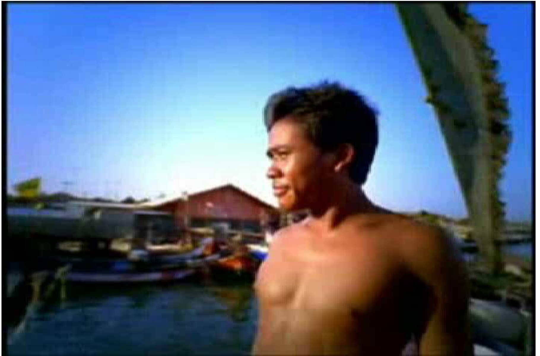
Rayuan Pulau Kelapa