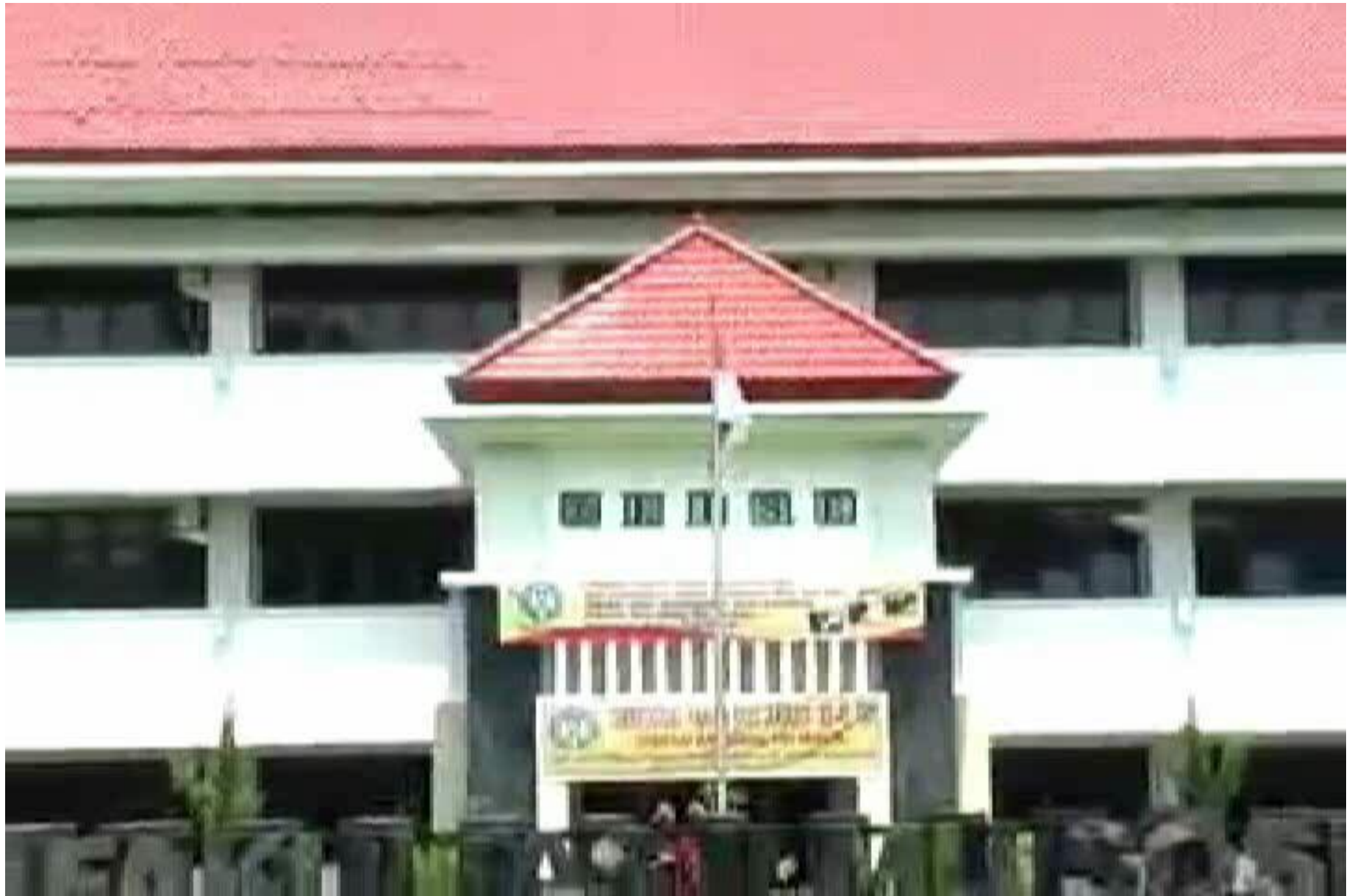
FISE – untuk Mhs/Akademik.