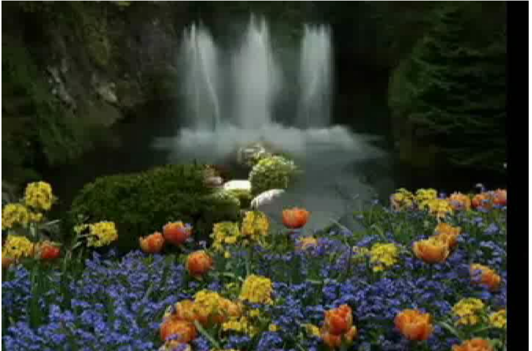
Menjelajah Surga - Relaxing