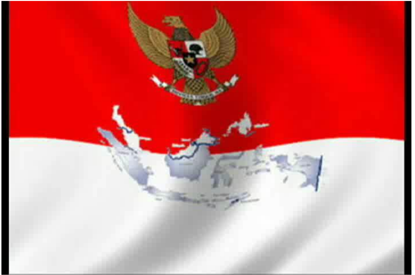
Indonesia Raya - 2