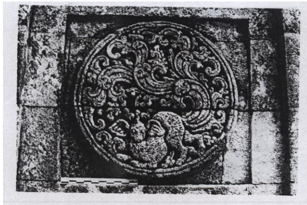
Gambar no.5.

Kemudian unsur hias medalion dengan motif berbentuk geometris diduga merupakan kontinuitas dari ornamen masa prasejarah, sebagaimana diketahui pada bentuk pilin berganda, tumpal, meander dan, belah ketupat. Tampaknya berbagai medalion yang ditemukan di sebaran candi-candi Jawa Timur adalah berbentuk belah ketupat dengan dipenuhi motif hias sulur-suluran. Selanjutnya motif hias medalion dengan motif tumbuh-tumbuhan atau sulur-suluran paling banyak ditemukan pada kaki dan tubuh candi sebagian besar gaya Jawa Timur. Hal ini diduga karena menurut tradisi klasik sulur-suluran sebagai simbol kesuburan dan merupakan kelanjutan motif candi Kalasan Jawa Tengah. Hanya saja di candi-candi Jawa Timur motif sulur-suluran selalu keluar dari tubuh binatang dan melingkar menyerupai bentuk medalion (lihat gambar no 5).