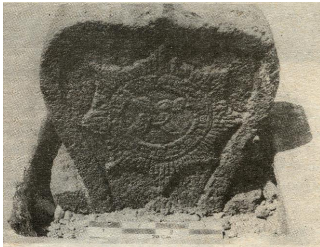
Gambar no. 7

Damais (1957) dalam penelitiannya berkaitan dengan unsur hias medalion adalah dilakukan di kompleks makam Tralaya, tepatnya di desa Sentanareja, Trowulan, Majakerta. Disebutkan bahwa di situs makam Tralaya terdapat sejumlah 12 buah batu nisan dengan selalu memuat kalimat Thayyibah dan surat Alquran , menunjukkan angka tahun yang tertua 1203 saka atau 1281 M dan yang termuda 1533 saka atau 1611 M. Sebagian besar pada batu nisan tersebut selalu diberi unsur hias medalion surya majapahit , sehingga oleh penduduk setempat menyebut dengan kuburan srengenge . (lihat gambar no. 7)