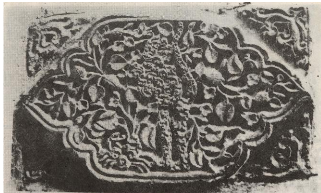
Gambar no. 9

Lain halnya dengan salah satu medalion dengan motif penggambaran makhluk hidup yang distilisasi, adalah suatu konsekwen bahwa para seniman harus wajib menegakkan hukum Islam. Perubahan dari Hindu ke Islam dijaga agar tidak terjadi keterkejutan budaya, adalah sesuatu yang wajar karena para seniman masih terbiasa dengan sebelumnya yaitu sering menciptakan relief atau arca dengan menggambarkan makhluk hidup. Hal ini dapat dilihat kasus di masjid Mantingan, Jepara yang dibangun pada tahun 1559 M. (lihat gambar no- 9).