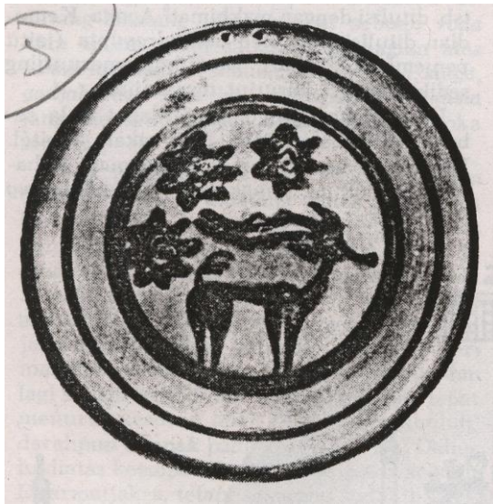
Gambar no. 1

menemukan 250 buah materai dan lempengan batu berbentuk bulat mirip medalion, tetapi setelah dicermati adalah pictograf atau huruf bergambar. Sebagaimana gambar di bawah ini materai batu dengan gambar binatang lembu yang sekaligus sebagai pictograf dan dugaan lebih lanjut binatang lembu sejak masa prasejarah sampai sekarang dikeramatkan oleh penduduk.