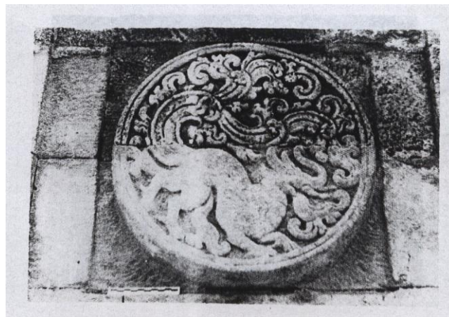
Gambar no 4

binatang yang teridentifikasi sebagai motif hias medalion menurut Kempers (1959: 21) di antaranya adalah : kancil, landak, musang, kambing, anjing, ular naga, serigala, kerbau, gajah, keledai, kasuari, babi hutan, rusa, lembu, harimau, kucing, burung hantu, merpati, burung rangkong, burung bangau, burung puyuh, burung merak, angsa, jago, kadal, tikus, buaya, kelinci, tapir, burung betet, dan kuda. Kemudian motif hias yang terkategori sebagai makhluk hidup adalah selalu terkait dengan mitologis Hindu. Pada umumnya makhluk tersebut tidak terdapat di dunia nyata tetapi hanya berada dalam alam imajinasi, di antaranya yang sering digunakan adalah burung Garuda, Naga, Kalamakara, dan berbagai makhluk yang tidak dapat diidentifikasi bentuknya. Sebagai contoh dalam gambar no: 4 adalah salah satu medalion yang berada di candi Penataran, yaitu seekor binatang berkepala seperti gajah, memiliki belalai dan dua gading. Akan tetapi binatang tersebut memiliki dua tanduk dan dari mulutnya keluar lidah api. Posisi tubuhnya menunduk dan keempat kakinya menyerupai bentuk kaki binatang buas, dengan kuku yang tajam. Dari ujung ekornya keluar sulur-suluran yang dipahatkan memenuhi sisa bidang medalion tersebut.