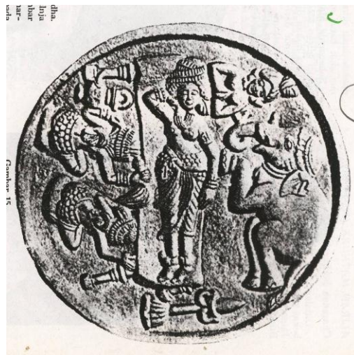
Gambar no. 2 (sumber Cardozo, tt: 21)

Sebagaimana gambar no 2 adalah salah satu medalion berbetuk skuensi sinopsis terletak nomer tiga dari empat medalion yang dipaparkan pada vedika atau dinding pagar candi Barhut. Medalion tersebut menggambarkan ketika dewi Maya sedang tidur ditunggu kedua inangnya dalam keadaan hamil, mimpi bertemu dengan gajah putih yang tidak lain adalah sang Budha yang nanti setelah lahir menjilma pada putranya, yaitu pangeran Sidharta Gautama.