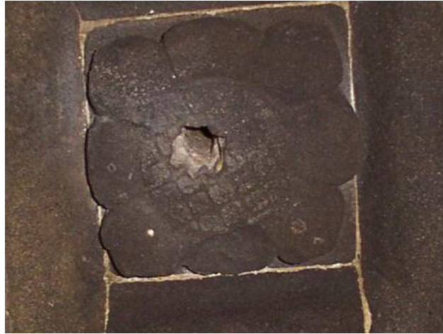
Gambar no. 3 medalion candi Gebang

Kedua motif hias madalion tersebut dalam hal teknik pemahatan juga mengikuti model relief candi Jawa Tengah, yaitu haut relief atau relief tinggi. Relief tersebut selalu dipaparkan mendekati bentuk trimatra bersandar pada dinding candi sebagaimana gaya Jawa Tengah pada umumnya. Menurut Krom unsur hias pada candi yang terdapat pada periode Jawa Tengah ini keberadaannya diambil dari unsur-unsur flora dan fauna India, maka para seniman atau taksaka selalu membuat hasil karya seni pahat relief menjadi sesuatu yang mewah dan diolah sebaik-baiknya.