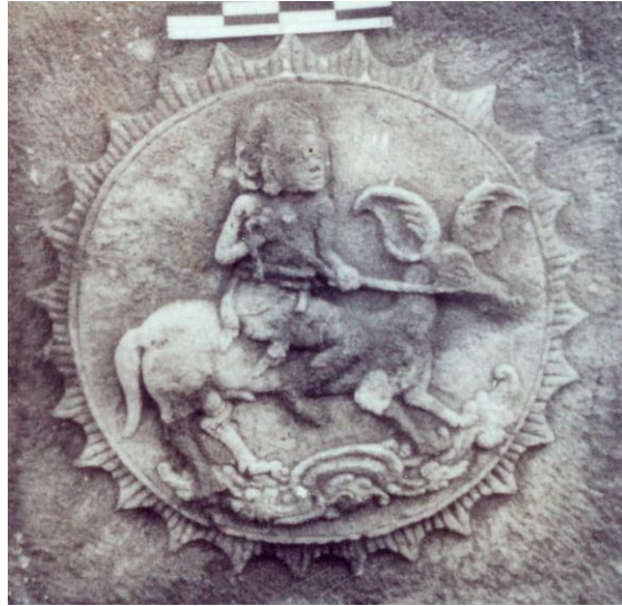
Gambar no. 6

Selagi terjadi masa puncak kebudayaan Hindu melalui kekuasaan Majapahit, bersamaan dengan masa tersebut tampaknya mulai abad XIII terdapatlah masyarakat pemeluk Islam yang bermukim tidak jauh dari istana. Dalam kaitan ini tampaknya Islam juga mempengaruhi tradisi penciptaan seni hias medalion beserta dengan kaligrafi mengiringi perkembangan khususnya pada seni bangun sakral atau turbah , yaitu gabungan antara masjid dan makam yang di dalamnya terdapat bangunan cungkup dan nisan. Selain ditempatkan pada bangunan sakral, medalion juga dipaparkan pada bangunan sekuler misalnya istana, rumah-rumah penduduk, dan taman. Hanya saja ketika itu seni arca mengalami kemunduran karena dikaitkan dengan kaidah hukum Islam tentang larangan untuk menggambarkan makhluk hidup. Sebaliknya dalam hal seni hias dengan motif tumbuh-tumbuhan terjadi perkembangan. Pelbagai ragam hias tersebut sering diwujudkan dalam bentuk medalion atau yang sejenis yang biasanya diukirkan pada bahan logam maupun kayu. Berbagai ornamen tumbuh-tumbuhan tersebut menjadi gaya motif lokal di antaranya adalah motif Majapahit, Pajajaran, Madura, Cirebon, Yogyakarta, Surakarta, Bali, dan Jepara.