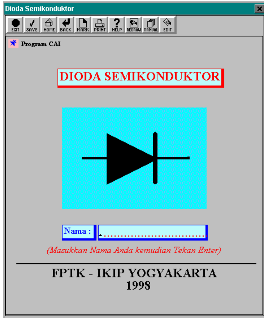
Gambar 2. Contoh halaman judul Program CAI