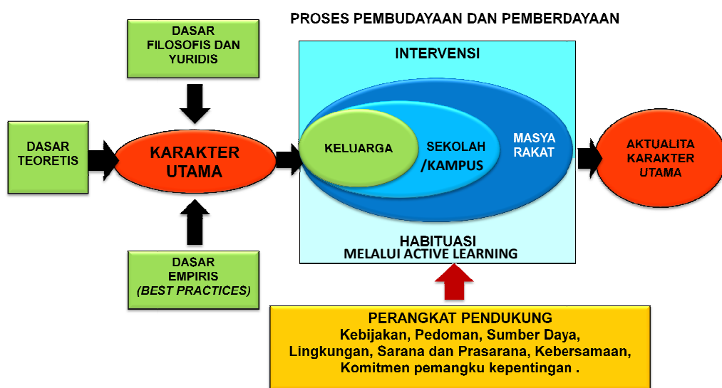
Gambar 1. Konteks Makro Pengembangan Karakter Melalui Active Learning