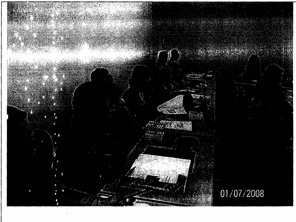
Peserta Workshop sangat antusias memperhatikan pemaparan materi dalam Workshop