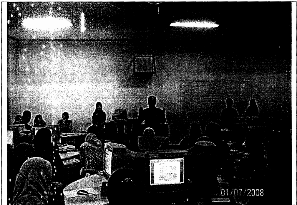
Guru-guru dengan dipandu oleh PakKharis dan Marzuki sedang membuat latihan dari Software Arbeitblätter per Mausclick.